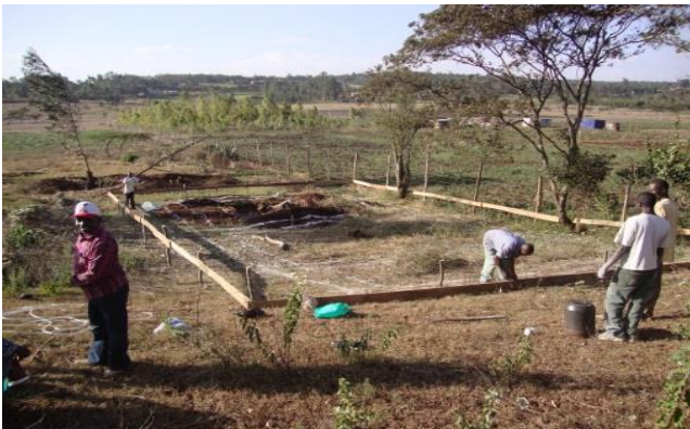
Byggnation startade 2011.