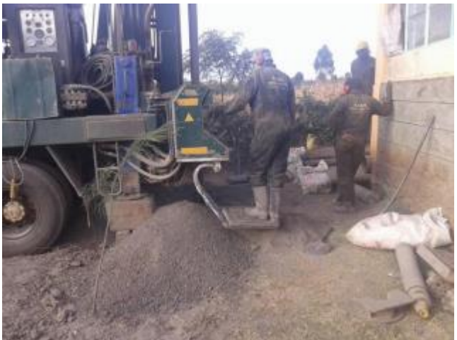
Här borras den 300m djupa brunnen.