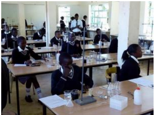
Kemisal med labutrustning från Göteborg.