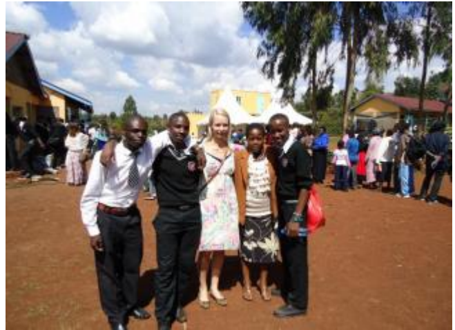
Mycket folk kom och firade studenterna.