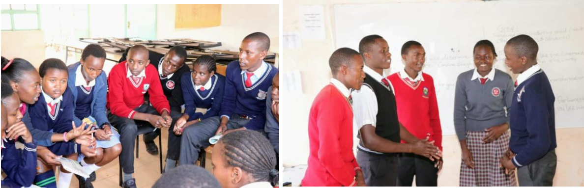
Lärorika gruppdiskussioner och övningar under workshopen.

I oktober hölls en workshop i ledarskap för elever från skolor i Kajiado (huvudort i Rift Valley). Syftet är att skapa en bättre framtid genom att utbilda och uppmuntra morgondagens ledare.