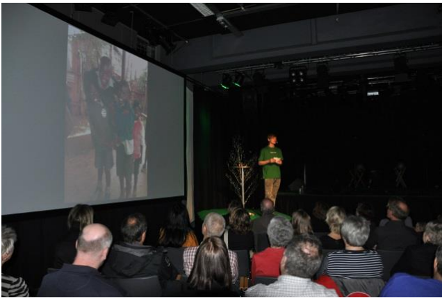
Insamlingsgala i Göteborg.