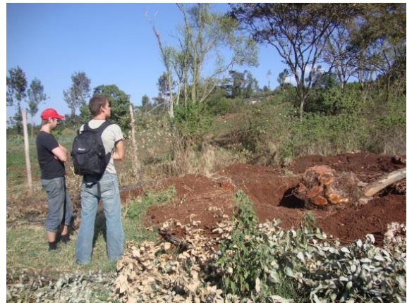
Inspektion av marken i Kenya.