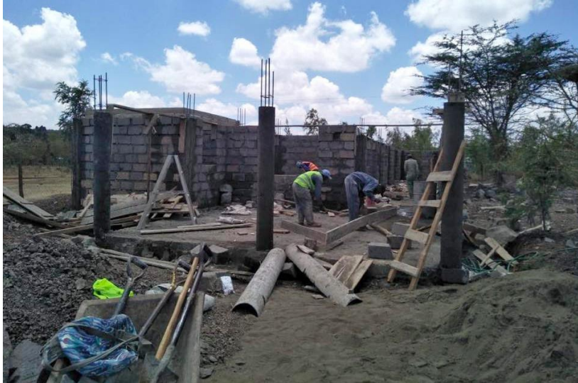
Byggarna jobbar på för fullt för att bli klara med kliniken.

Byggnationen av mödravårdskliniken pågår för fullt. Alla väggar är i dagsläget på plats och tanken är att kliniken skall invigas i november.