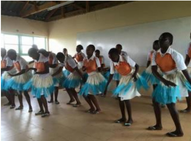
Härlig dansuppvisning på examensfirandet.

Skolan expanderar mycket, bland annat med fler klassrum och en stor matsal. Antal elever ökar från 50 till 200. På sommaren 2015 anländer en container från Göteborg fylld med bland annat datorer, möbler, köksutrustning och labutrustning. På hösten 2015 tar första klassen examen vilket firas rejält med sång, dans och grillfest. Samarbetet med Zelmerlöw & Björkman Foundation påbörjas och bland annat finansierar de borring av en 300m djup vattenbrunn.