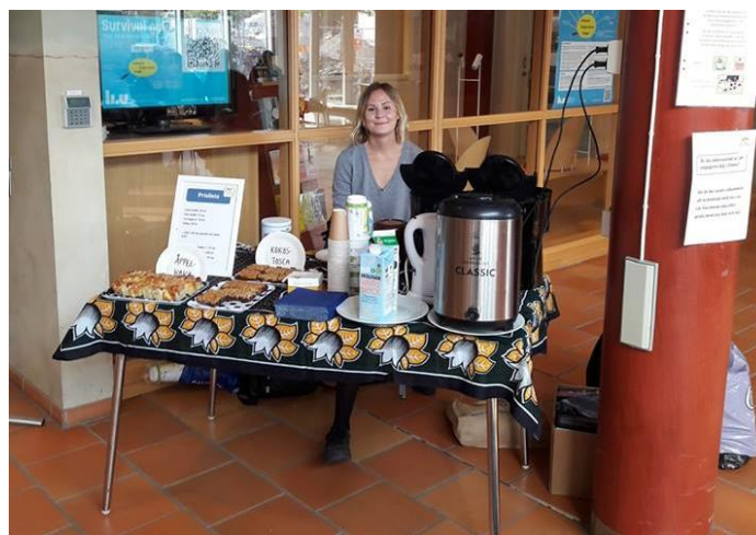
Fika varje tisdag på Linköpings Universitet, mums!

Stor eloge till Elimu-gänget som säljer fika varje tisdag på Linköpings Universitet!