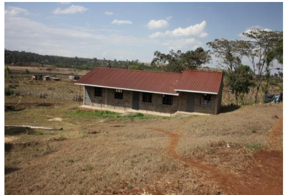
Första klassrummen klara.